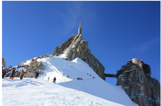
Sur l'épaule, avant de chausser les skis