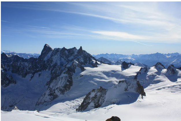
Vus sur les Grandes Jorasses et la vallée blanche