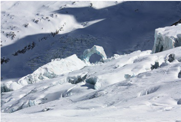
Dans la vallée blanche