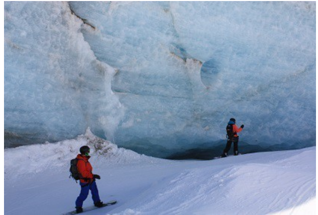
Canyon glacé dans la vallée blanche