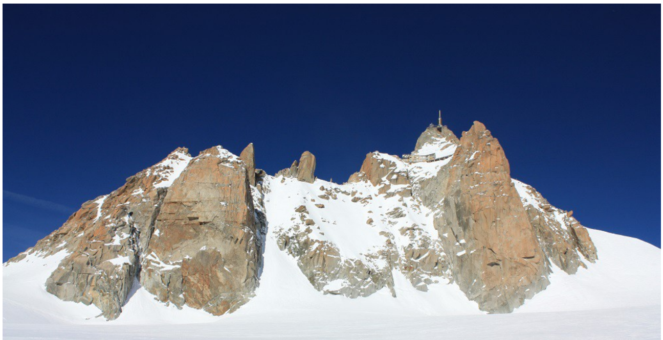
L'Aiguille du Midi vu de la vallée blanche