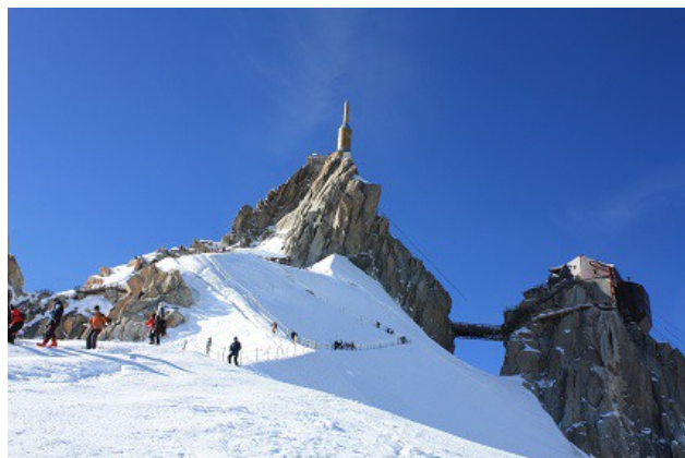
Sur l'épaule, avant de chausser les skis