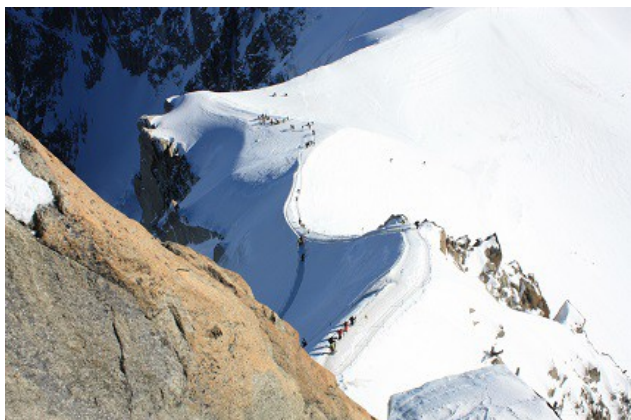
La descente de l'arête de l'Aiguille du Midi