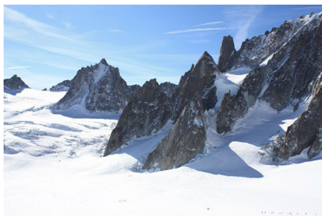
Vus sur la Tour Ronde et le grand capucin