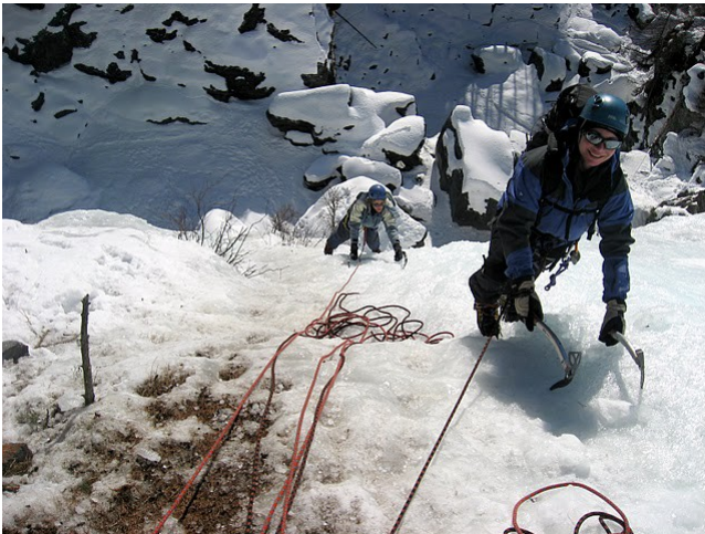
Cogne, c'est au soleil !