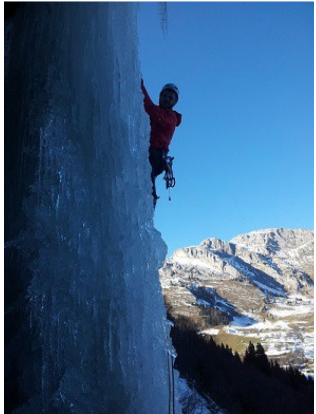
Dans le tube du reposoir