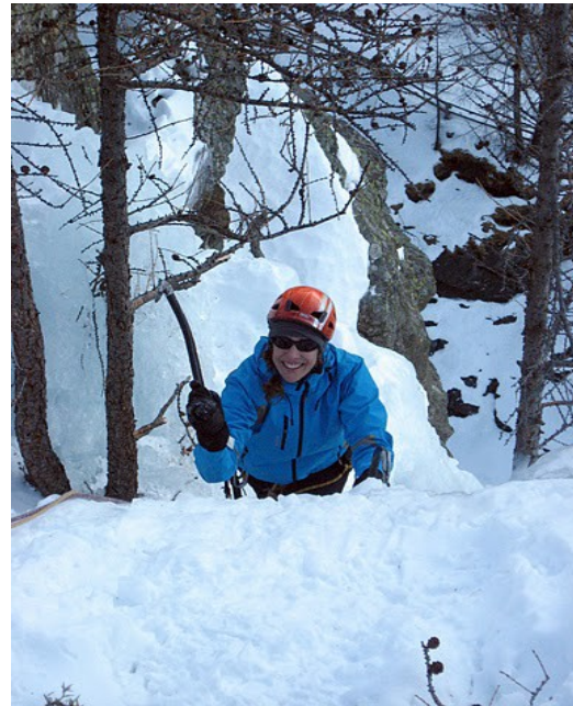
Cogne avec le sourire