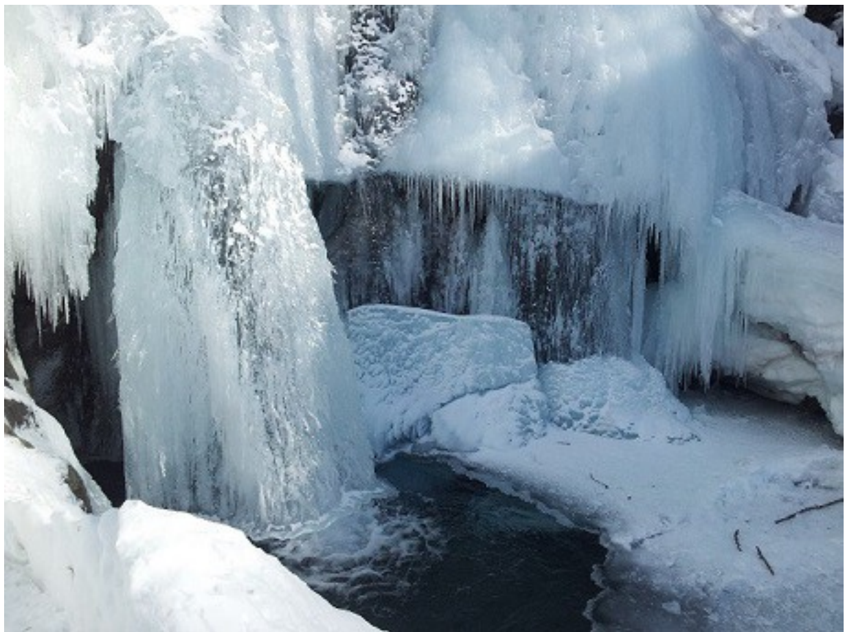
Les formes extravagantes de la glace