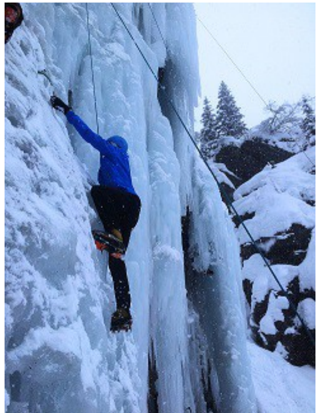
En action à la Stassaz