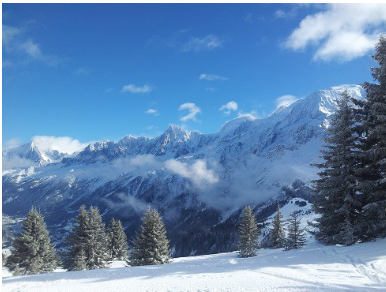
Vue depuis Les Houches