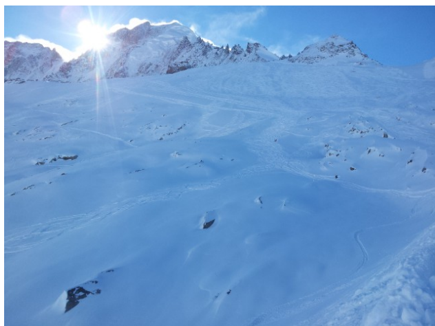
Traces aux Grands Montets